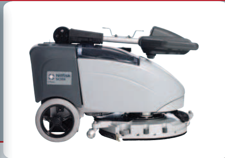
Kompaktin muotoilun ja taitettavan kahvan ansiosta SC350 on helppo kuljettaa ja varastoida, jopa silloin kun tilaa on vähän