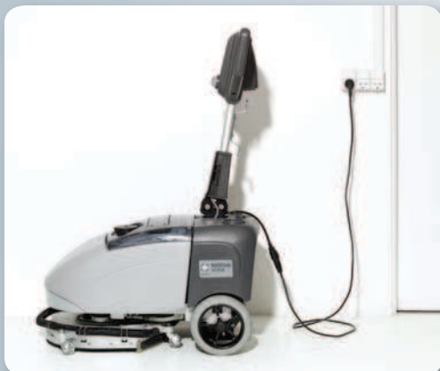
Sisäänrakennettu varaaja on vakiona kaikissa malleissa. Tämä säästää aikaa ja maksimoi tuottavuuden.