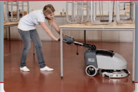
Koneen matalan profiilin ansiosta siivoaminen pöytien ja tuolien alta on helppoa