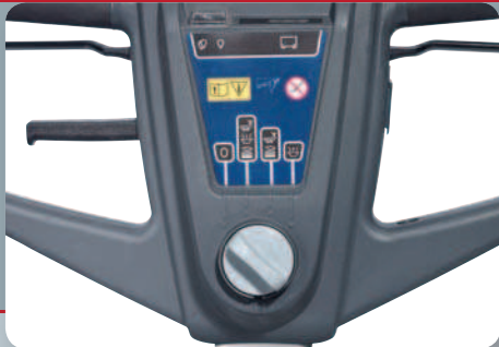
Ohjauspaneeli on erittäin helppokäyttöinen. Se tarjoaa 3 työskentelyvaihtoehtoa; pesu ja imu – vain pesu – vain imu